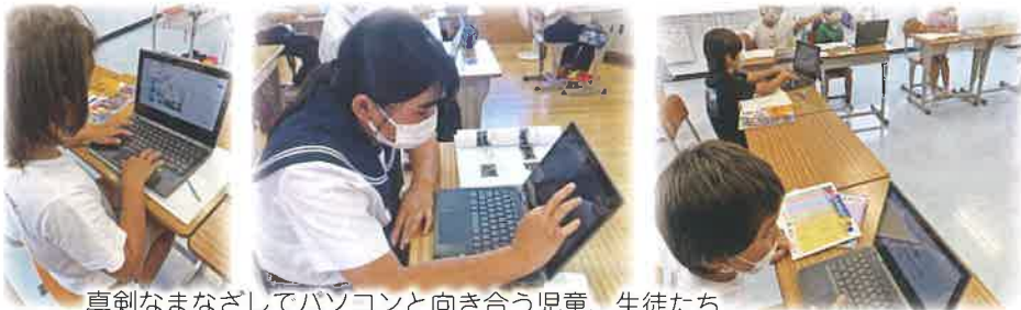
真剣なまなざしでパソコンと向き合う児童、生徒たち

これからの社会を生きる子ども達が主体的に学び、持続可能な島づくりに関わっていくことを目指して、多様な学び方を通して子ども達が自立できる学校教育に努めていきたいと考えています。