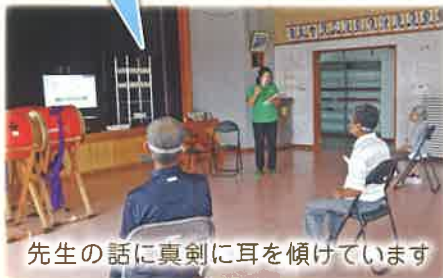
先生の話に真剣に耳を傾けています