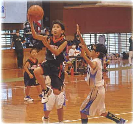
(男子決勝写真(株)八重山日報社提供)