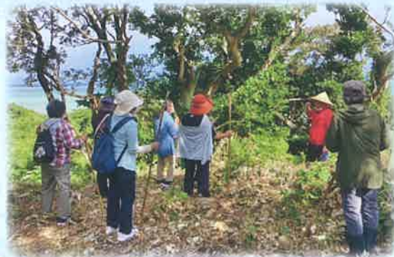
町指定史跡… ウティスク山遺跡