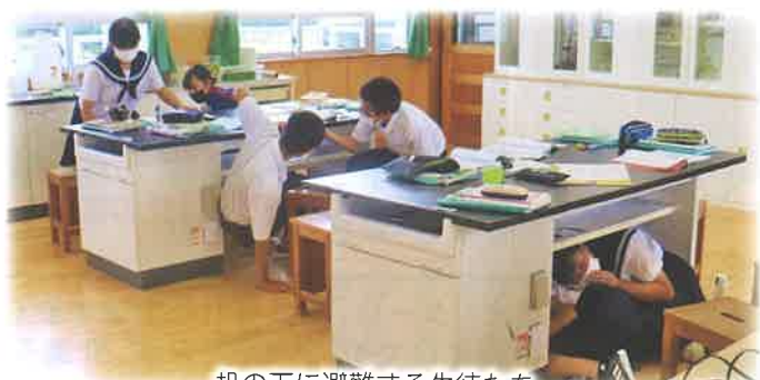
机の下に避難する生徒たち