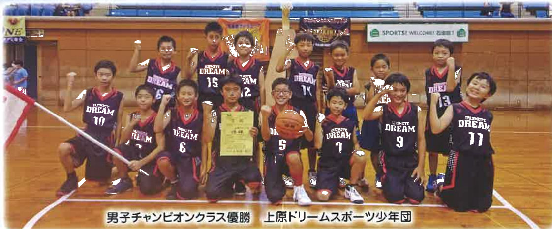
男子チャンピオンクラス優勝 上原ドリームスポーツ少年団