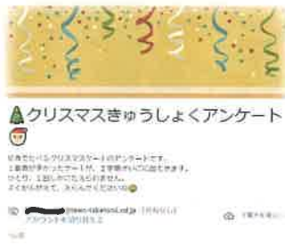
コンピュータ端末を活用した授業