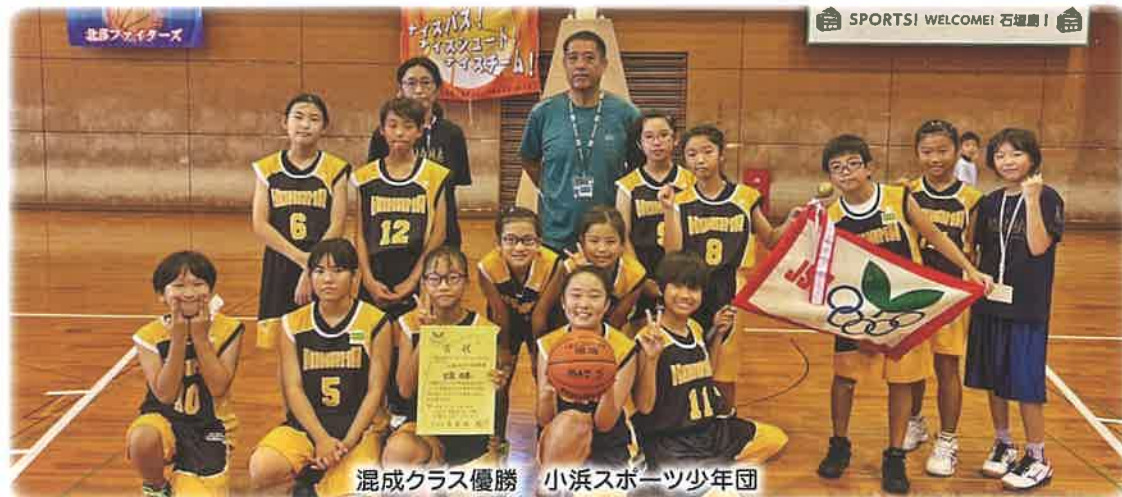
混成クラス優勝 小浜スポーツ少年団