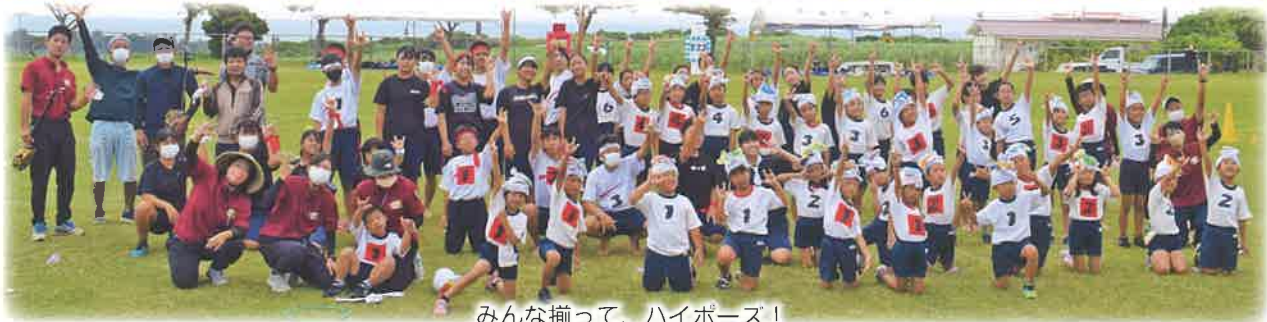
みんな揃って、ハイポーズ！