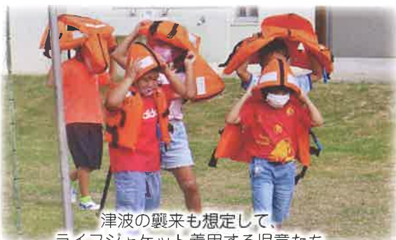
津波の襲来も想定して、ライフジャケット着用する児童たち